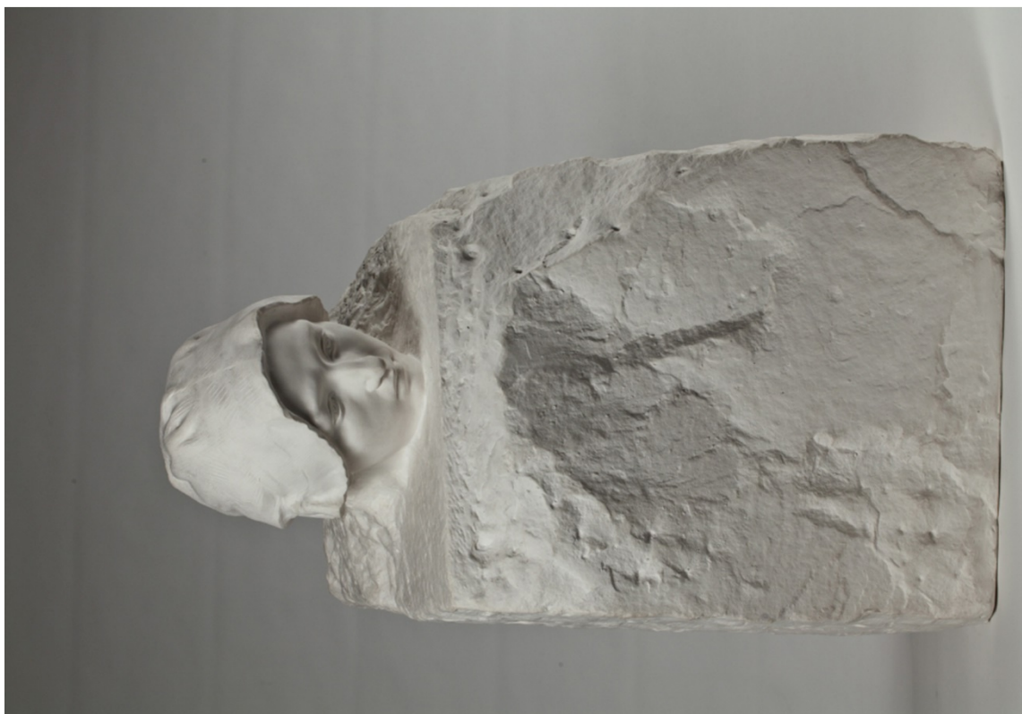
Auguste RODIN, La Pensée, 1893-1895, plâtre, H : 71,2 cm ; L : 42,1 cm ; P : 45,1 cm, Paris, Musée Rodin.